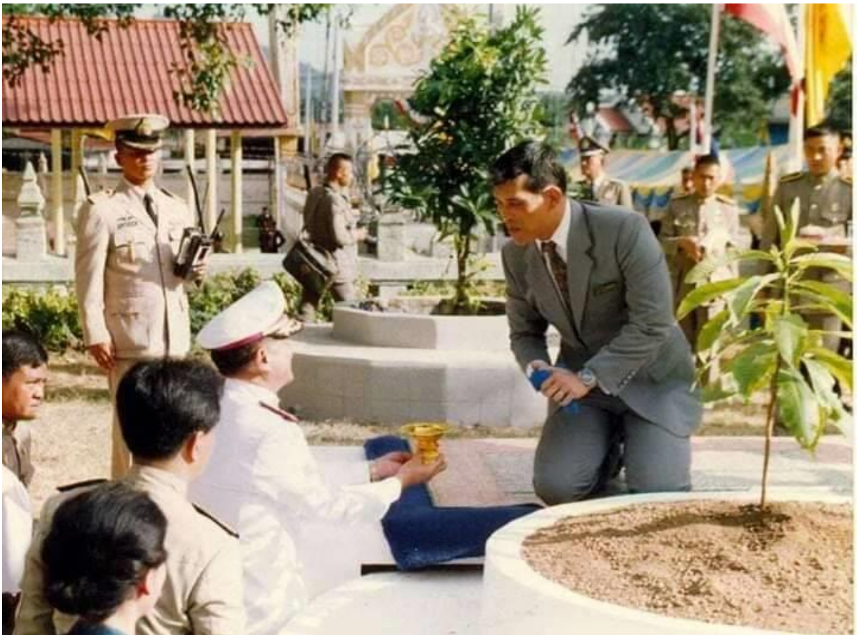
คำบรรยาย สมเด็จพระบรมโอรสาธิราชฯ สยามมกุฎราชกุมาร ทรงปลูกต้นสาละ (รังกา) เป็นที่ระลึก วันเสด็จทรงเปิดโรงเรียนพระปริยัติธรรม “สุธรรมนิมิต” หน้าพระอุโบสถ วัดสิริจันทรมิตรวรวิหาร ตำบลเขาพระงาม อำเภอเมืองลพบุรี จังหวัดลพบุรี