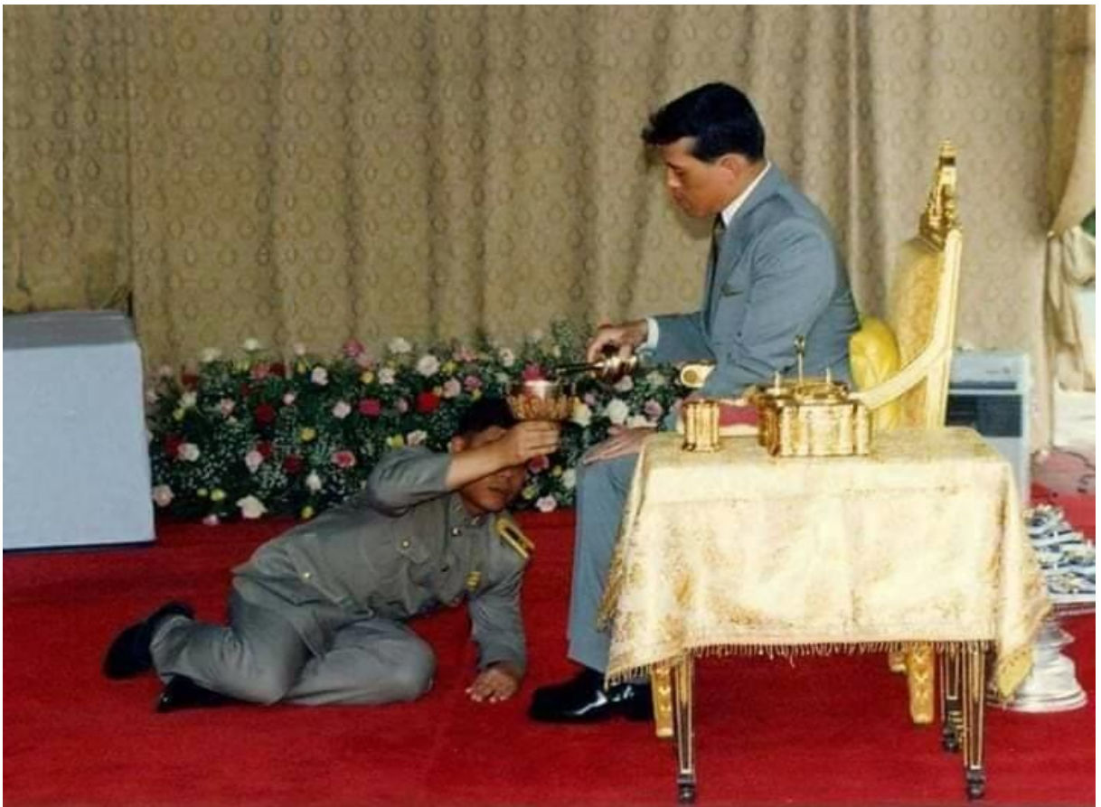
คำบรรยาย สมเด็จพระบรมโอรสาธิราชฯ สยามมกุฎราชกุมาร เสด็จพระราชดำเนิน ทรงเปิดโรงเรียน พระปริยัติธรรม “สุธรรมนิมิต” ณ วัดสิริจันทรมิตรวรวิหาร ตำบลเขาพระงาม อำเภอเมืองลพบุรี จังหวัดลพบุรี เมื่อวันที่ ๑๕ พฤศจิกายน ๒๕๓๗