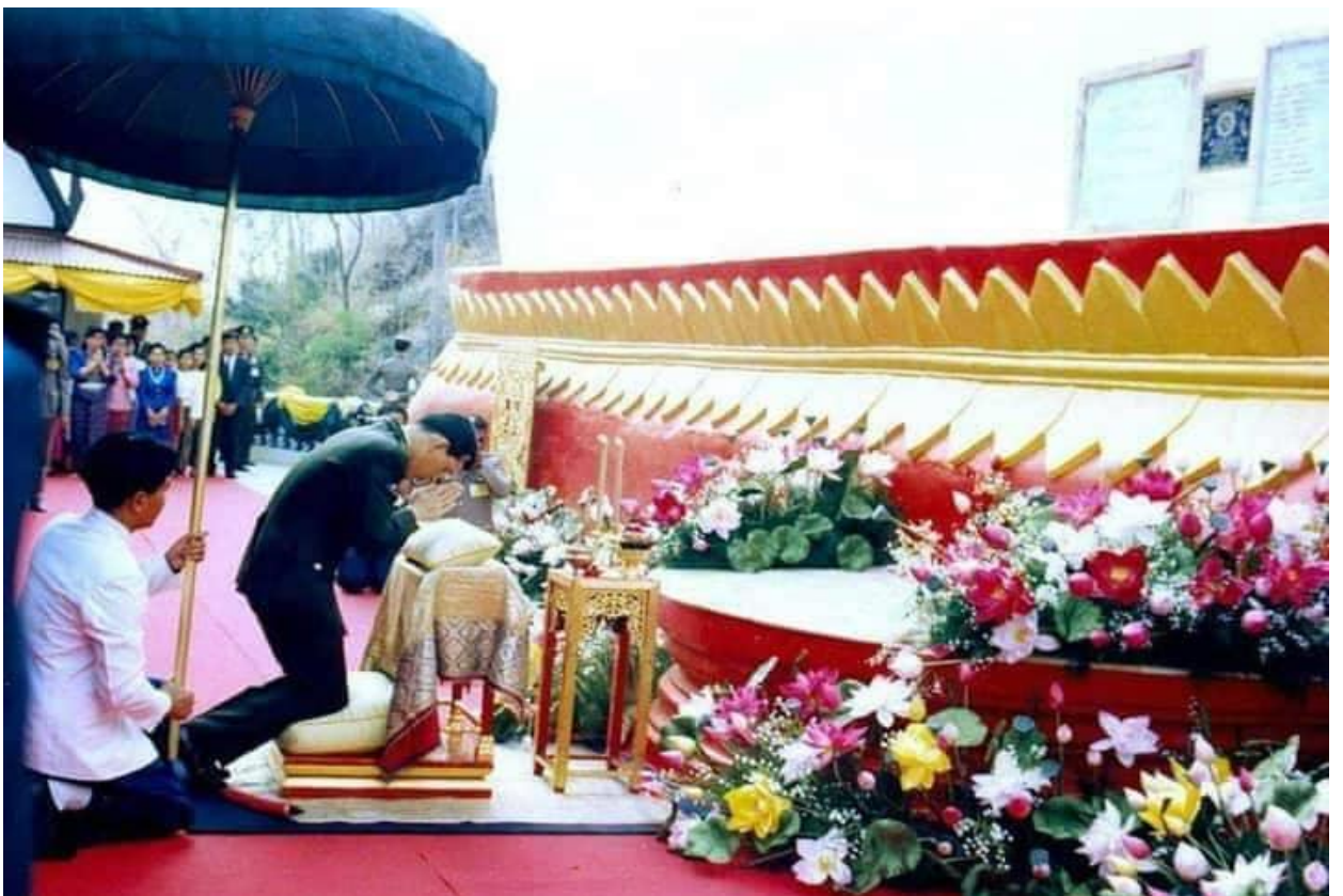
คำบรรยาย สมเด็จพระบรมโอรสาธิราชฯ สยามมกุฎราชกุมาร เสด็จพระราชดำเนิน ทรงบรรจุพระบรมสารีริกธาตุ เมื่อวันที่ ๒๖ กุมภาพันธ์ ๒๕๓๖ ณ วัดสิริจันทรมิตรวิหาร ตำบลเขาพระงาม อำเภอเมืองลพบุรี จังหวัดลพบุรี